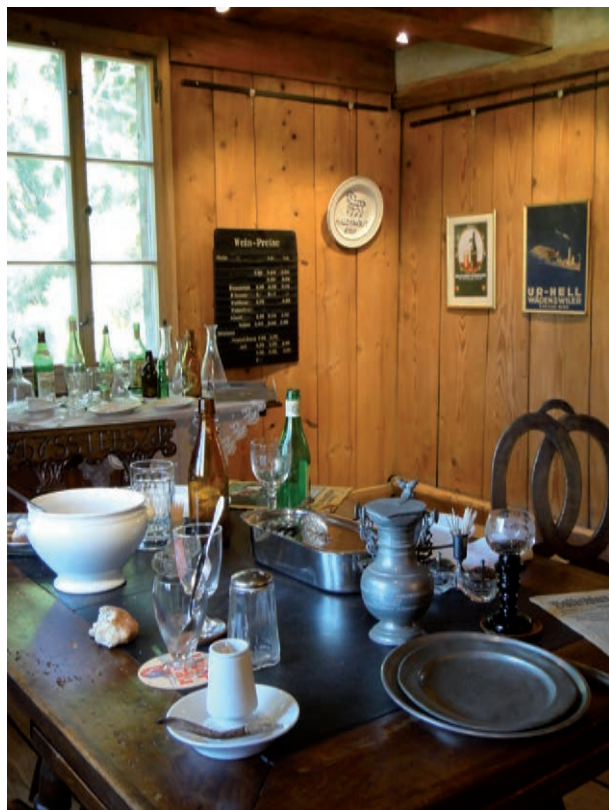
Ausstellung "De Leue und anderi Beize"

Jedes Jahr gestalten wir eine eigene Ausstellung in der lokale, regionale oder Themen aus der Zürichsee-Schifffahrt zum Zuge kommen. Basis ist unsere an zwei externen Orten gelagerte ortsgeschichtliche Sammlung und das Archiv.