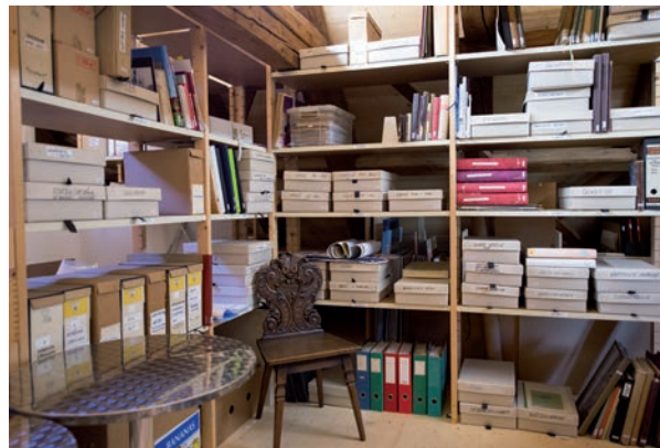
Archiv in der Kulturschüür Liebegg

Unser Archiv umfasst eine riesige Anzahl von Büchern, Broschüren, Dokumenten, Bildern, Fotos und Zeitungsausschnitten zur Geschichte Männedorfs und der Schifffahrt auf dem Zürichsee. Archiv und Fundus sind digital erfasst und stehen interessierten Kreisen zur Verfügung. Der Zugang erfolgt über unsere Homepage www.kulturschuer.ch